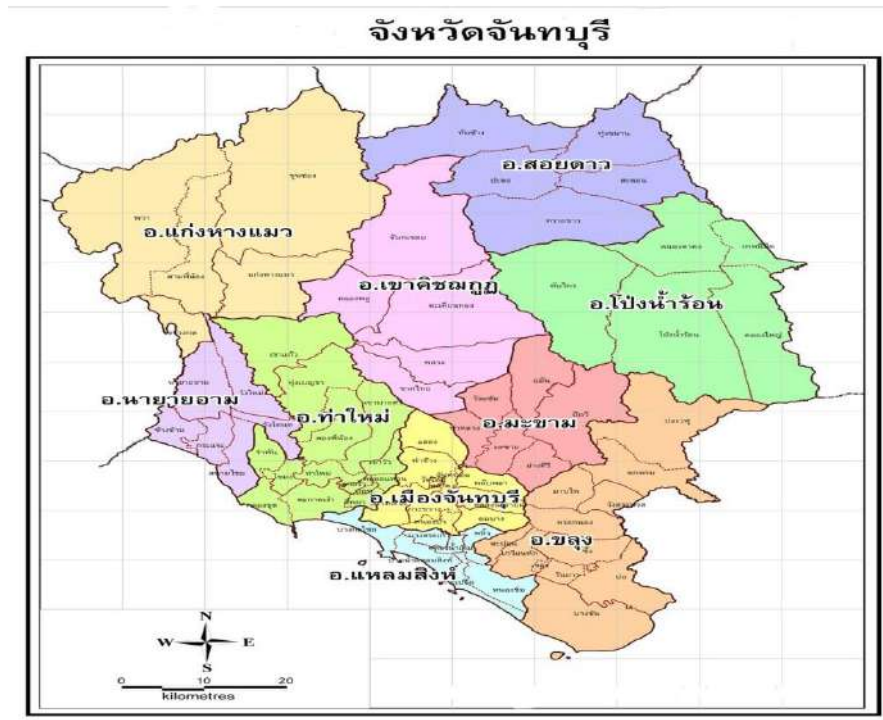
แผนที่จังหวัดจันทบุรี

จังหวัดจันทบุรี ตั้งอยู่บนพื้นที่ชายฝั่งทะเลภาคตะวันออกของประเทศไทย ระหว่างเส้นรุ้งที่ 12-13 องศาเหนือ และเส้นแวงที่ 101-102 องศาตะวันออก อยู่ห่างจากกรุงเทพมหานครประมาณ 245 กิโลเมตร มีพื้นที่ทั้งหมด 6,338 ตารางกิโลเมตร หรือ 3,961,250 ไร่ คิดเป็นร้อยละ 16.6 ของพื้นที่ภาคตะวันออก และเท่ากับร้อยละ 1.8 ของพื้นที่ทั้งประเทศ มีอาณาเขตติดต่อกับจังหวัดใกล้เคียง คือ